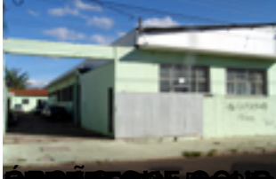
PROJETO DE AQUISIÇÃO DE IMÓVEL: Unidade de Saúde da Família Presidente Collor (USF)