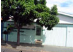
PROJETO DE AQUISIÇÃO DE IMÓVEL: Unidade de Saúde da Família Jardim Muscó (USF)