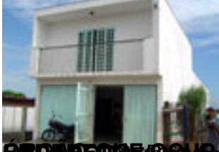
PROJETO DE AQUISIÇÃO DE IMÓVEL: Unidade de Saúde da Família Antenor Garcia (USF)