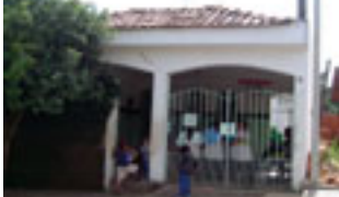
PROJETO DE AQUISIÇÃO DE IMÓVEL: Unidade de Saúde da Família São Francisco (USF)