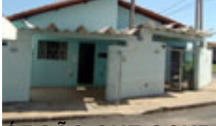
PROJETO DE AQUISIÇÃO DE IMÓVEL: Unidade de Saúde da Família Tortorelli (USF)